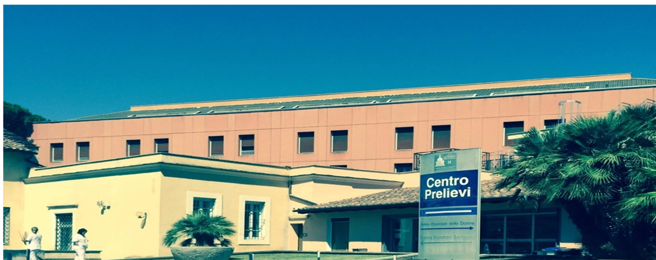
Foto 2: Ingresso Centro Prelievi via San Giovanni in Laterano n.155

Questo manuale descrive l'attività e le procedure del Centro Prelievi dell'Azienda Ospedaliera San Giovanni Addolorata, rappresenta uno strumento pratico, rivolto agli operatori del servizio, utile anche ai cittadini utenti che vi troveranno molteplici informazioni (la dislocazione dell'ambulatorio, le modalità per raggiungerlo, le modalità del prelievo ematico, la raccolta di altri campioni biologici, modalità di refertazione).